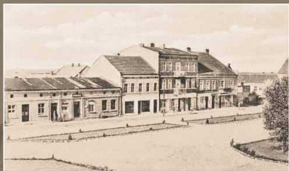
rok 1940 Widok rynku w Wieruszowie od strony zachodniej.