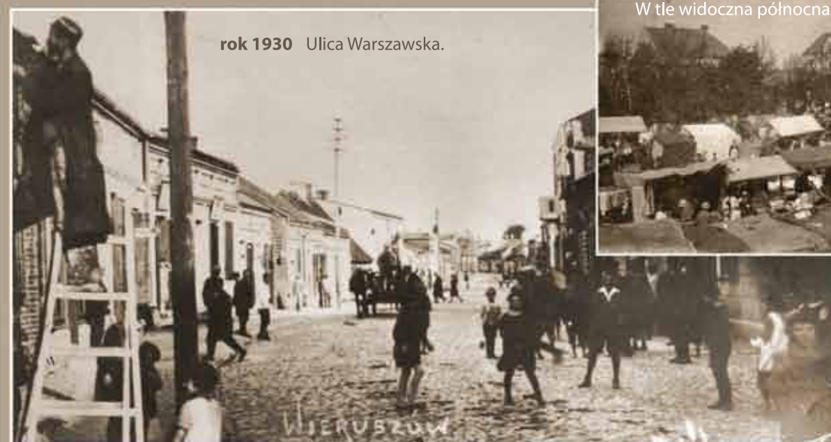
rok 1930 Ulica Warszawska.