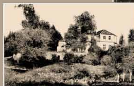
rok 1907 Zamek wieruszowski przed bombardowaniem artyleryjskim.