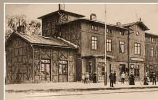
rok 1902 Dworzec PKP na Podzamczu.