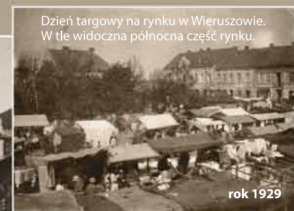
Dzień targowy na rynku w Wieruszowie. W tle widoczna północna część rynku.