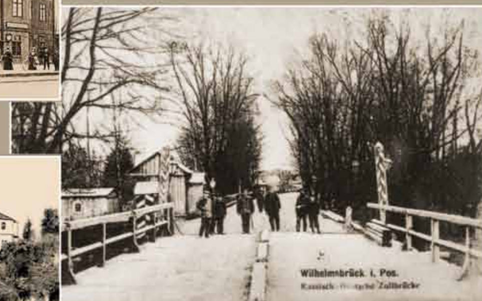
rok 1912 Przejście graniczne na rzece Niesób, oddzielającej zabór pruski od rosyjskiego. Zdjęcie wykonano od strony Wieruszowa w kierunku Podzamcza.